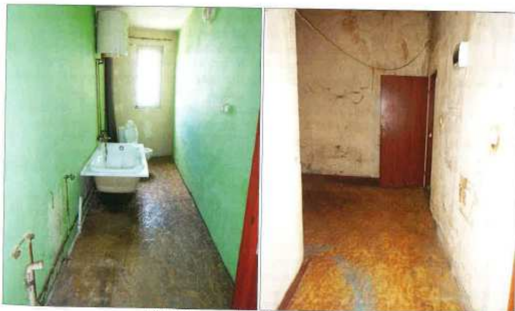
Widok fragmentu łazienki z wc i przedpokoju.