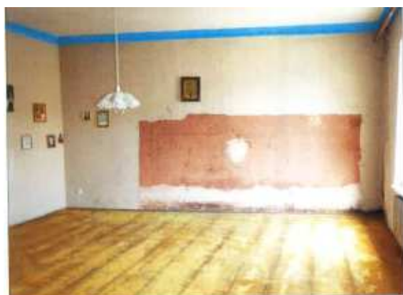
Widok fragmentu pokoju.