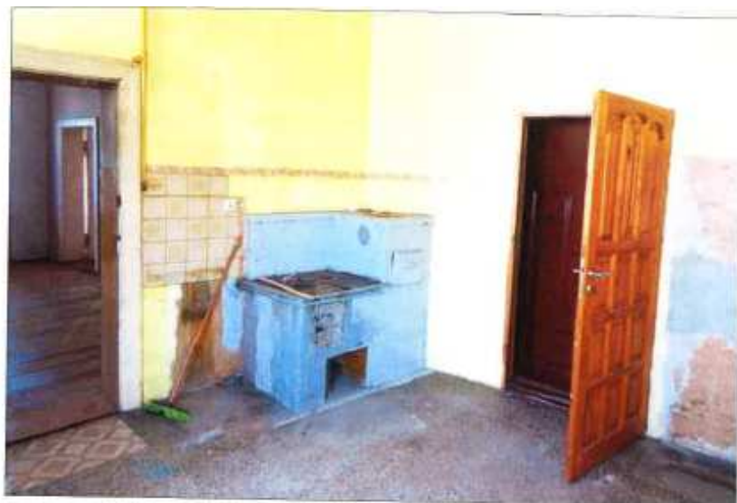
Widok fragmentu kuchni.