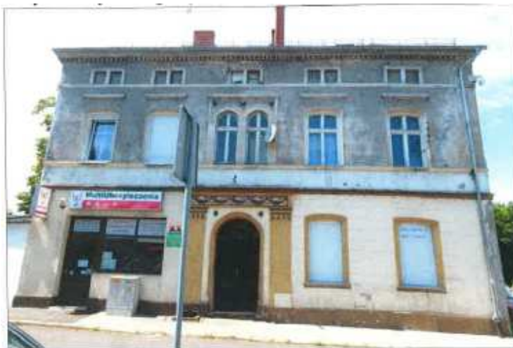
Widok elewacji frontowej – Plac Strażacki nr 5.

na sprzedaż lokalu mieszkalnego Nr 1 znajdującego się w budynku położonym w Lubaniu przy Placu Strażackim 5 wraz z udziałem we współwłasności nieruchomości gruntowej (działka nr 5, AM 4, Obręb III o powierzchni 164 m 2 , JG1L/00020876/7)