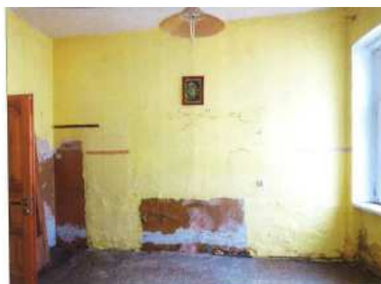
Widok fragmentu pokoju.